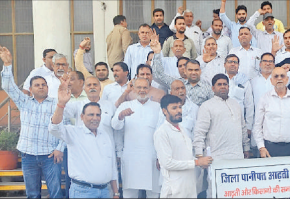
पानीपत। जिला सचिवालय पर प्रदर्शन करते हुए आढ़ती।

पानीपत जिला अनाज मंडी आढ़ती एसोसिएशन के बैनर तले जिला की मंडियों के आढ़तियों ने मंगलवार को जिला सचिवालय में अपनी मांगों को लेकर प्रदर्शन किया। प्रदर्शनकारियों ने तहसीलदार को मुख्यमंत्री नायब सैनी के नाम ज्ञापन सौंपा। इधर, आंदोलन का नेतृत्व कर रहे पानीपत मंडी आढ़ती एसोसिएशन के जिला प्रधान