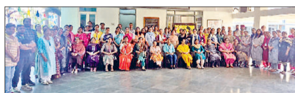
अंबाला। कार्यक्रम के दौरान मौजूद शिक्षक।