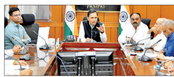
पानीपत। श्री हनुमान जयंती शोभायात्रा को लेकर बैठक करते उपयुक्त, पुलिस कप्तान आदि।

दो लाख से अधिक श्रद्धालुओं भाग लेंगे, तैयारी में जुटा प्रशासन, धार्मिक व सामाजिक संस्थाएं