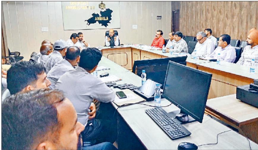
अंबाला। मीटिंग के दौरान मौजूद अधिकारी व मंडी कारोबारी।

बैठक के दौरान उन्होंने डीएफएससी से जिले में कितनी मंडियां हैं, कौन-कौन सी खरीद एजेंसियां कार्य करेंगी। पिछले वर्ष कितनी गेहूं की आवक आई थी और इस वर्ष कितनी आने की उम्मीद है उसकी जानकारी ली।