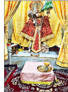
श्री हनुमान की तस्वीर।