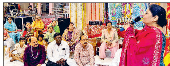
अंबाला। दाती दा दरबार कार्यक्रम में प्रस्तुति देती कलाकार।