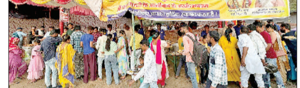
तरावड़ी। मां बाला सुंदरी मंदिर में गैलेक्सी परिवार की ओर से चल रहा भंडारा

वलेक्सी परिवार करता रहता है धार्मिक आयोजन बता दें इससे पूर्व भी गैलेक्सी परिवार की ओर से वृंदावन, बद्रीनाथ, द्वारका धाम में भी श्रीमद् भागवत सप्ताह यज्ञ व विशाल भंडारे का आयोजन किया गया था। जिसमें शहर के सभी लोग वृंदावन में श्रीमद् भागवत कथा सुनने पहुंचे थे। गैलेक्सी परिवार की ओर से पूरा वर्ष कहीं ना कहीं हमेशा पुण्य के कार्य होते रहते हैं। हम परमपिता परमात्मा से प्रार्थना करते हैं ईश्वर गैलेक्सी परिवार पर अपनी कृपा बरसाए रखे हुए ऐसे ही समाज की सेवा करते रहें। जा रहा है। यह विशाल भंडारा जिला प्रातः 4:00 बजे से लेकर रात्रि 12:00 बजे तक चलता रहता है। इस भंडारे में श्रद्धालुओं के लिए व्रत का भोजन भी अलग से बनाया जा रहा है। जिसमें रोजाना हजारों श्रद्धालु रूपी प्रसाद ग्रहण करते हैं।